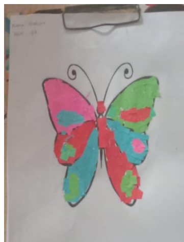
Gambar 3 Gambar Siklus I