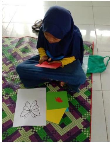
Gambar 5 Anak yang sedang membuat kolase