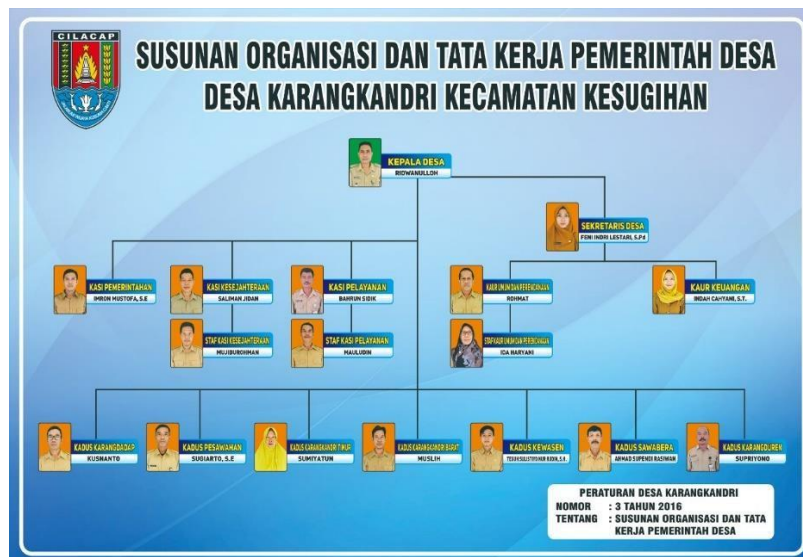
Gambar 4.50 Struktur Organisasi Pemerintah Desa Karangkandri