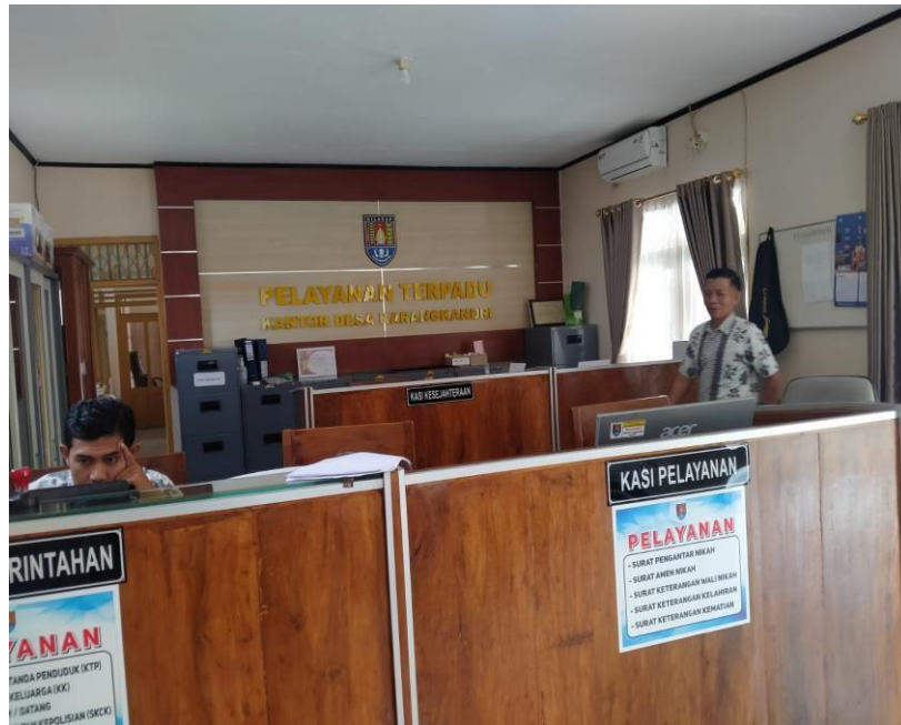
Gambar 4.49 Ruang Pelayanan Terpadu Kantor Desa Karangkandri