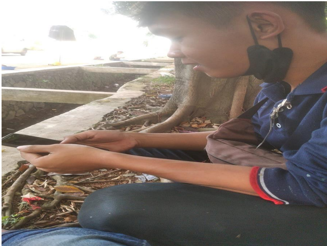
Gambar 4.52 dokumentasi warga saat sedang mengisi kuesioner