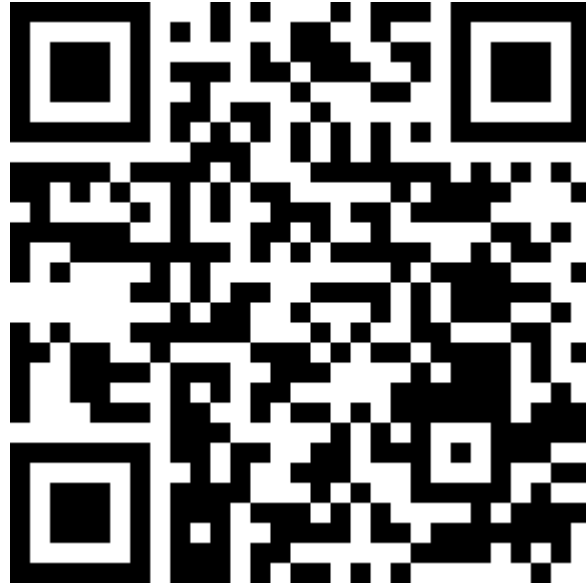
Gambar 4.54 QR Code Kuesioner untuk Responden