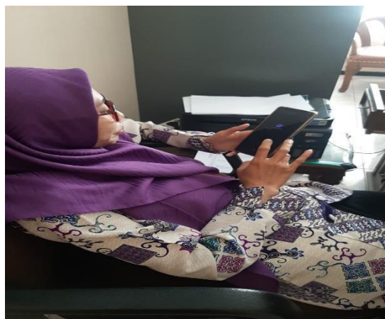
Gambar 4.53 dokumentasi perangkat desa saat sedang mengisi kuesioner