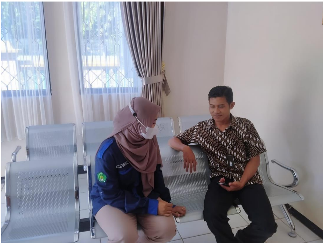
Gambar 4.51 wawancara dengan kasi pemerintah