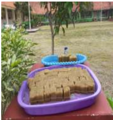
“BIBIT TANAMAN HYDROPONIK”