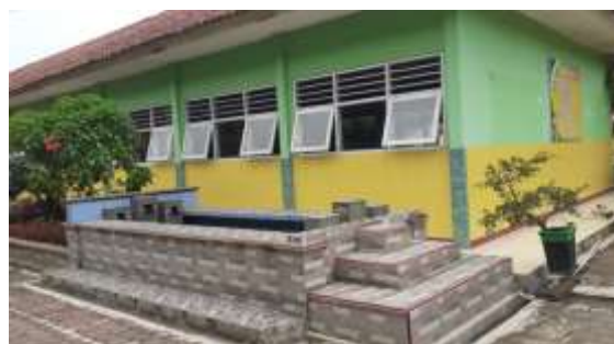
“KOLAM TADAH HUJAN”