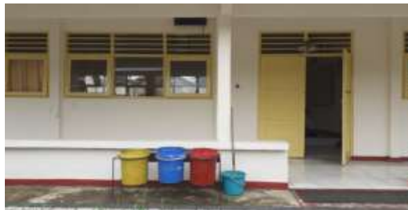
“TEMPAT SAMPAH SESUAI JENIS SAMPAH”