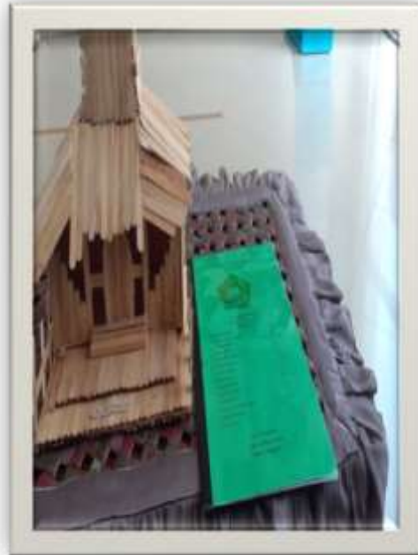
Hasil tugas Peserta Didik