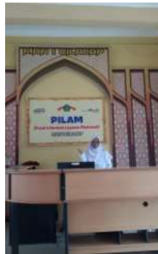
“PUSAT INFORMASI LAYANAN MADRASAH”