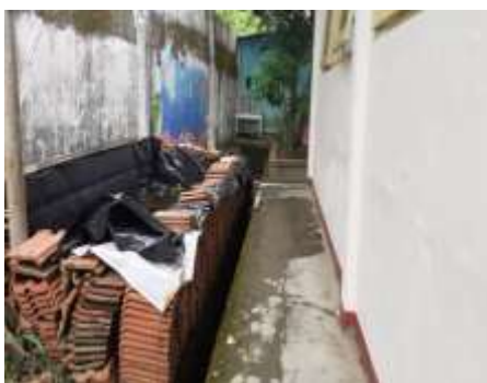
“KOLAM IKAN DARI GENTENG”