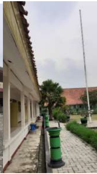
“TEMPAT CUCI TANGAN”