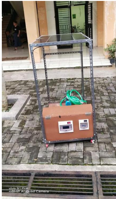
Gambar 11. Uji panel surya dibawah sinar matahari