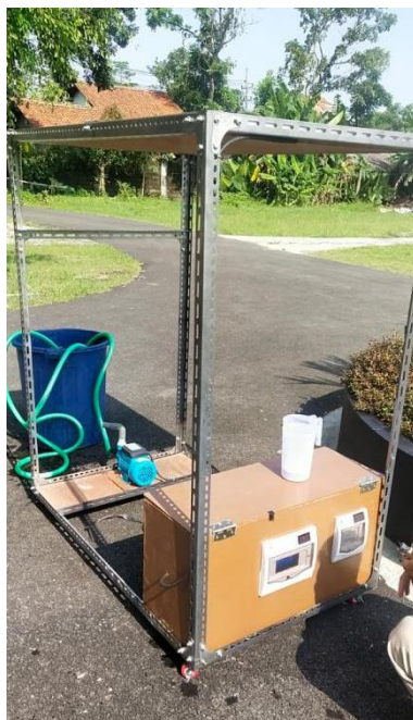
Gambar 13. Uji pengukuran debit air pompa tenaga surya ke-1