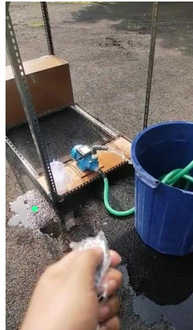
Gambar 12. Uji kinerja remote wireless