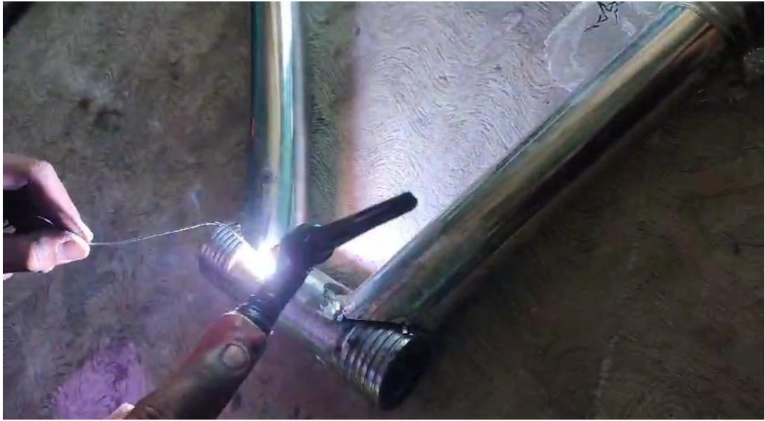
Gambar 5 proses pengelasan kerangka