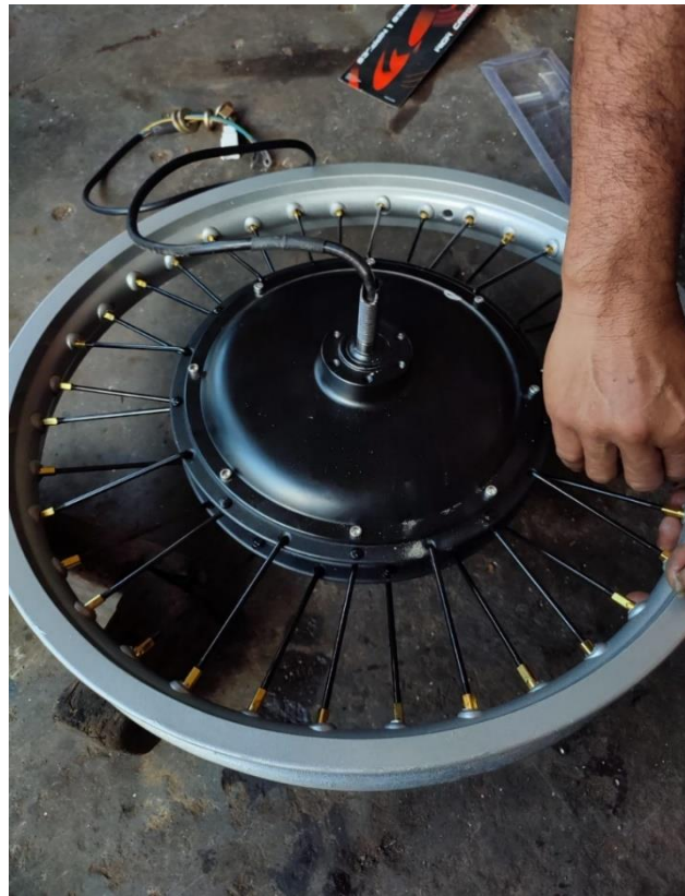
Gambar 4 pemasangan dinamo ke velg