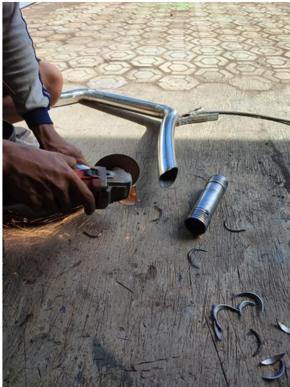
Gambar 2 proses penggerindaan kerangka