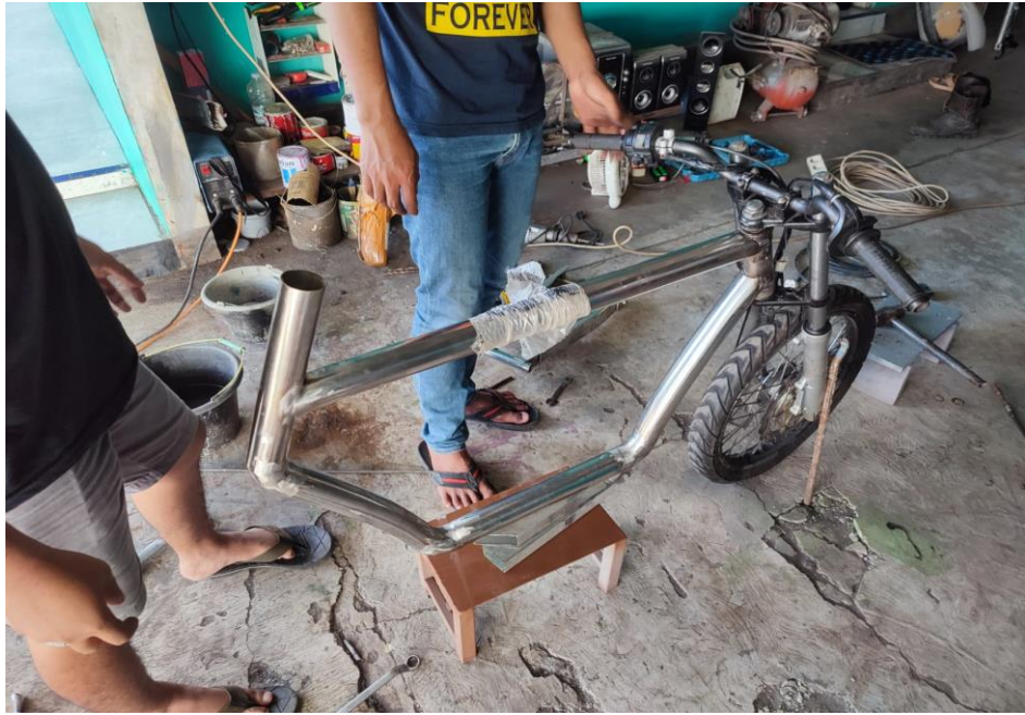
Gambar 1 proses pemasangan arm