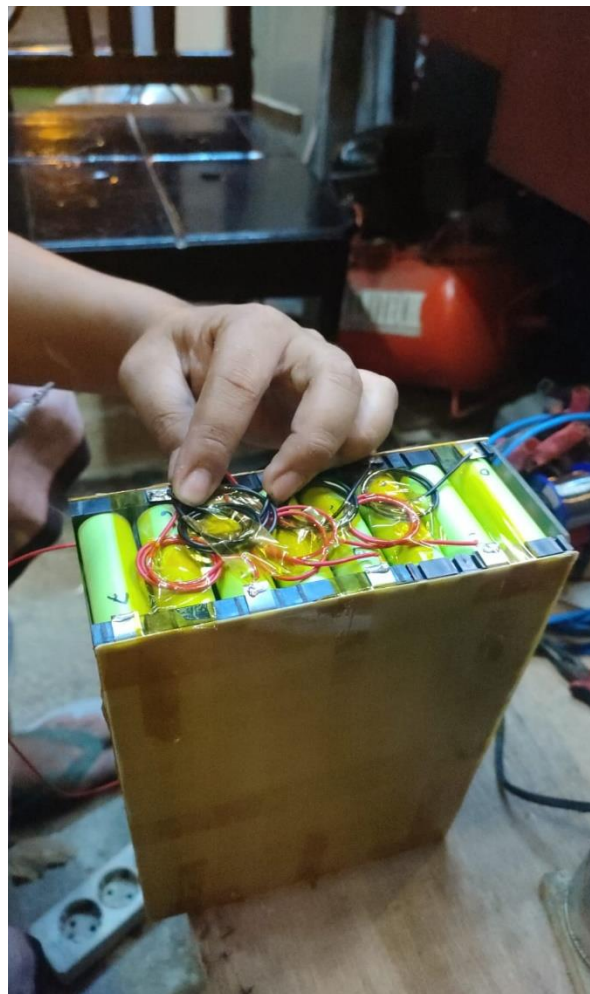
Gambar 6 wiring baterai