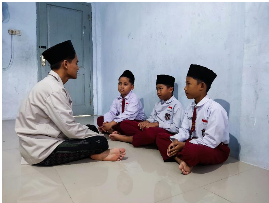
Wawancara Siswa SD IT Miftahul Huda 520