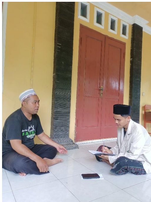
Wawancara Perwakilan Wali Murid SD IT Miftahul Huda 520