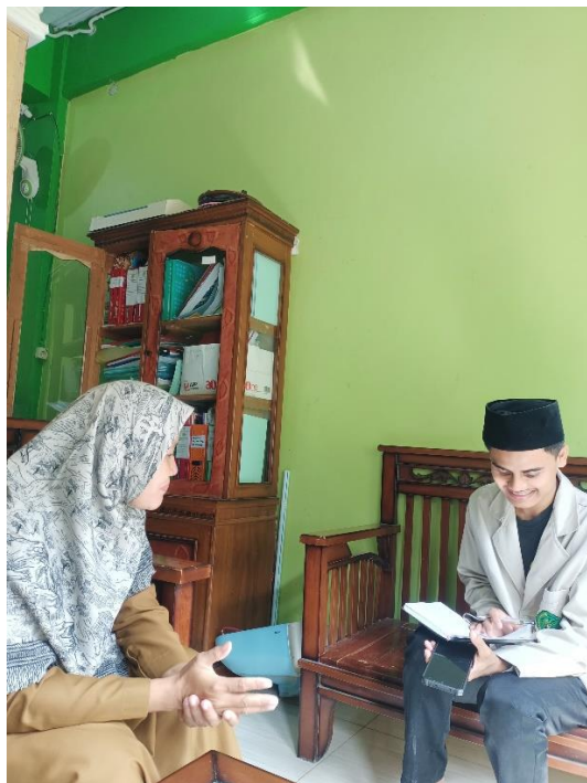
Wawancara Kepala Sekolah SD IT Miftahul Huda 520