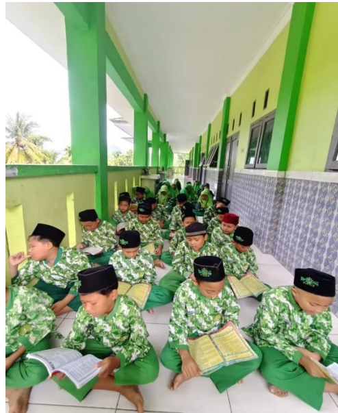
Murojaah hafalan Siswa SD IT