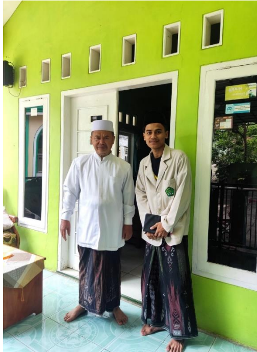
Wawancara Ketua yayasan Miftahul Huda 520