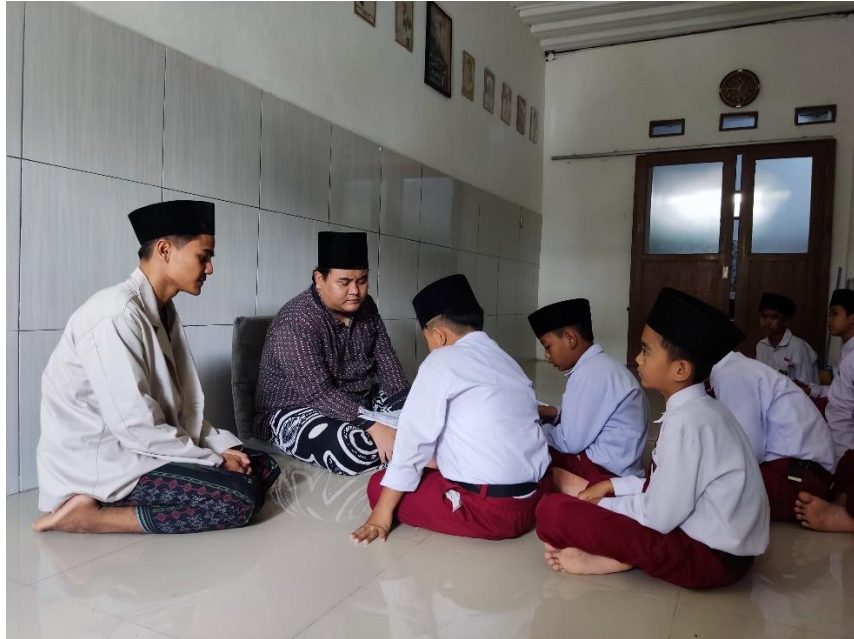
Wawancara Guru Tahfidz