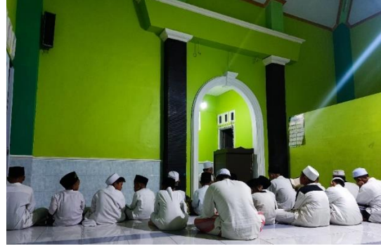
Siswa SD IT di Pesantren