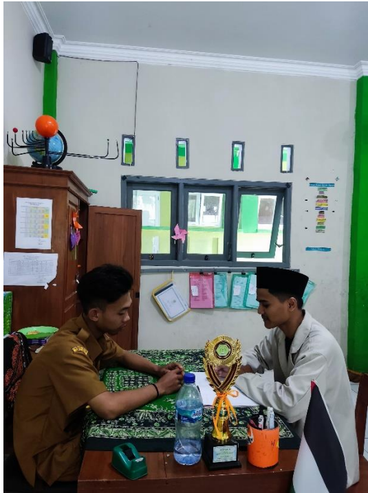
Wawancara Guru SD IT Miftahul Huda 520