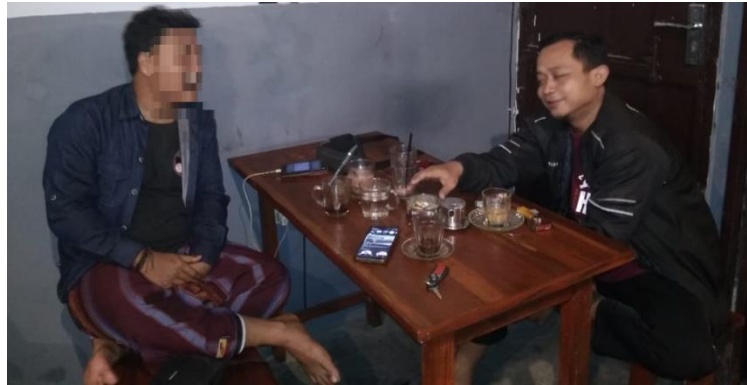
4.8 Wawancara bersama narasumber Kumbang (Pelanggan/pengguna jasa PL "Freelance")