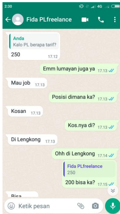
4.2. Chat dengan Pemandu Lagu "Freelance" ANGGREK