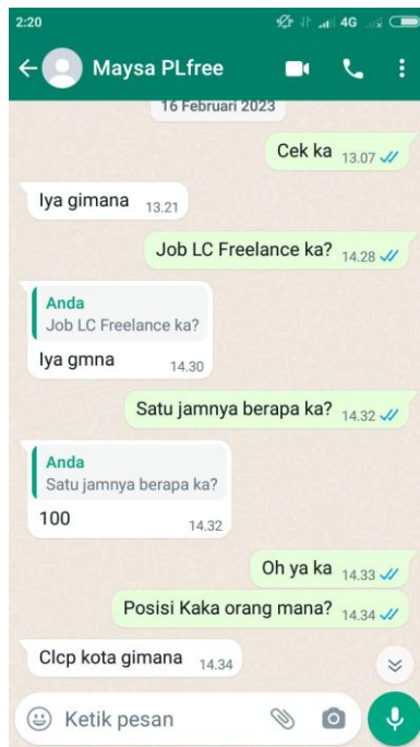
4.6 Chat dengan dengan Pemandu Lagu "Freelance" MELATI