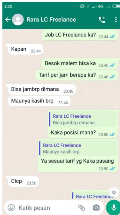
4.7 Chat dengan Pemandu Lagu "Freelance" KENANGA