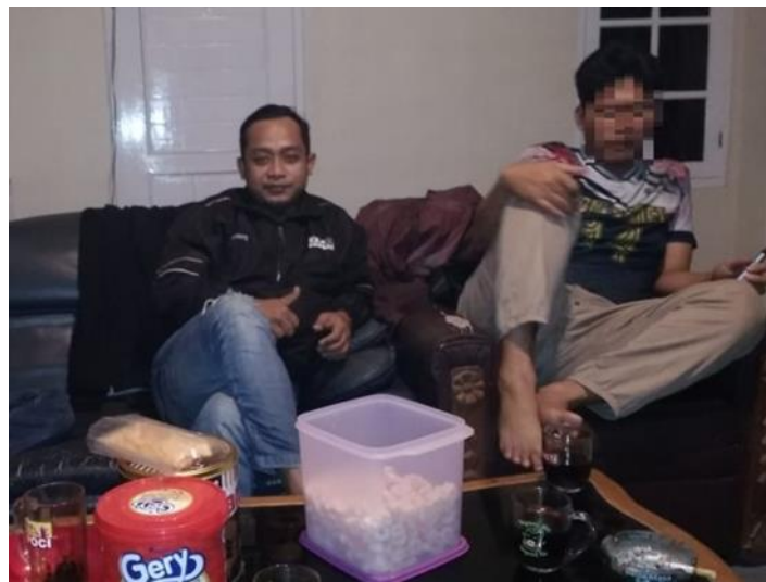
4.9 Wawancara bersama narasumber Kumbang Madu (Pelanggan/pengguna jasa PL "Freelance")