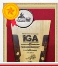
Indonesia Green Awards 2020 Kategori Pengolahan Sampah Terpadu Program Kemiren Asri