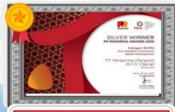
Public Relations Indonesia Awards 2020 Kategori BUMN Subcategory Community Based Development Kemiren Asri