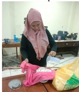
proses penimbangan ampas kelapa