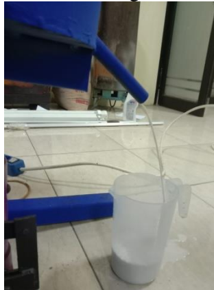
proses pemerasan santan dengan mesin press hidrolik