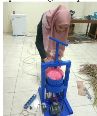
proses penaruhan ampas kelapa ke mesin press hidrolik