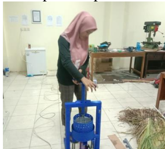
proses pemutaran ulir mesin