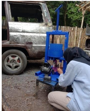
pembuatan mesin press hidrolik