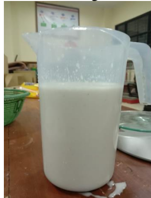
hasil santan yang diperas dengan mesin press hidrolik