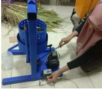
proses mengoprasikan mesin press hidrolik