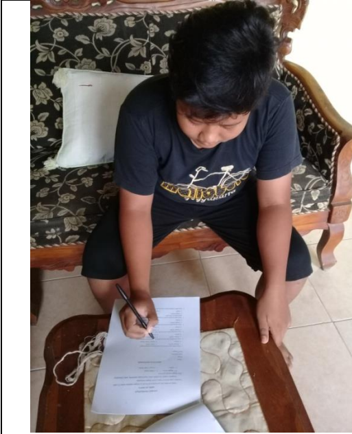
FOTO KEGIATAN MENGISI TES DAN ANGKET