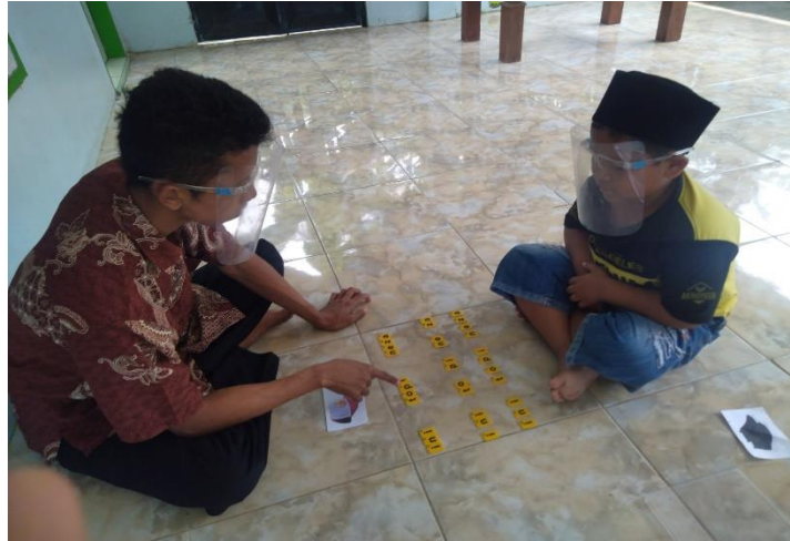
Gambar 1. Kegiatan pelaksanaan tindakan pada pembelajaran membaca permulaan melalui Metode SAS