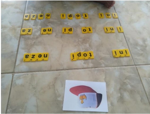
Gambar 2 dan 3 Kalimat yang disusun oleh siswa