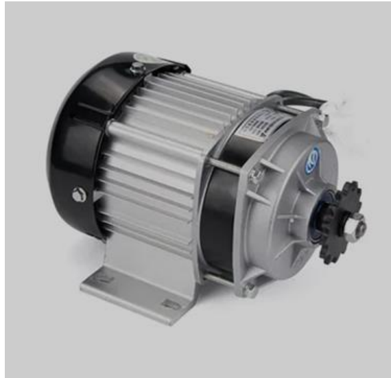
Gambar 2.3 Brushless DC Motor (BLDC)

Untuk menghitung torsi yang dihasilkan oleh motor BLDC dan torsi pada setiap gigi transmisi dapat dilakukan dengan rumus