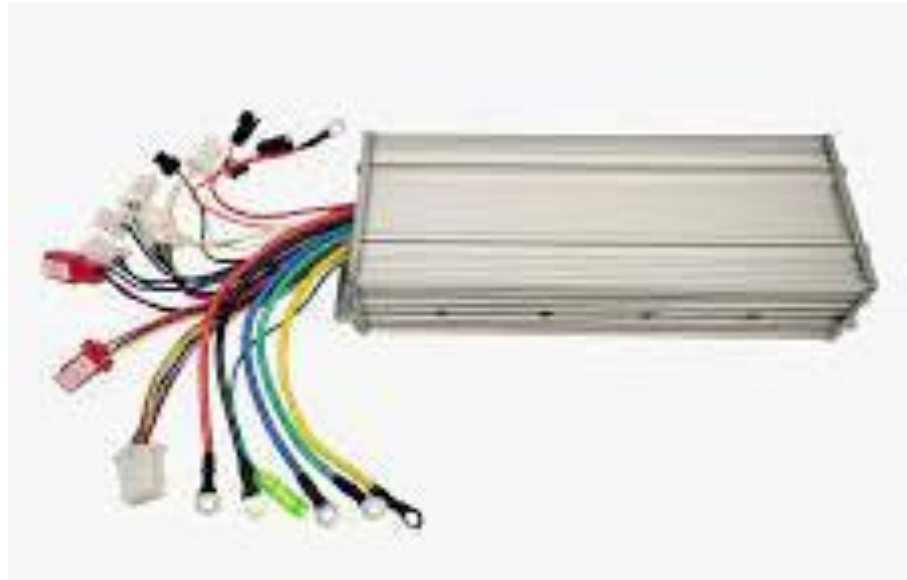
Gambar 2.4 Controller BLDC

Controller BLDC adalah satu komponen sistem pengaturan yang berfungsi mengolah sinyal umpan balik dan sinyal masukan acuan ( setpoint ) atau sinyal error menjadi sinyal kontrol. Sinyal error disini adalah selisih antara sinyal umpan balik yang dapat berupa sinyal keluaran plant sebenarnya atau sinyal keluaran terukur dengan sinyal masukan acuan ( setpoint ). Pada motor BLDC, kontroler berfungsi untuk mengatur arus masukan yang harus dialirkan ke kumparan stator untuk dapat menimbulkan medan elektromagnet yang sesuai untuk memutar rotor. Hal inilah yang menjadi pembeda dengan motor DC konvensional, dan menggantikan kerja komutasi mekanisnya.