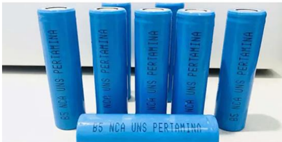
Gambar 2.5 Batrai litium-Ion

Baterai Lithium-Ion terdiri dari Anoda, Elektrolit, Seperator dan Katoda. Pada umumnya, katoda dan anoda terdiri dari dua bagian, yaitu material aktif sebagai keluar masuknya ion lithium dan pengumpul elektron sebagai collector current . Prinsip kerja baterai Lithium-Ion adalah ketika Anoda dan Katoda terhubung maka elektron akan mengalir dari anoda menuju katoda, dan listrik pun mulai mengalir. Di bagian dalam baterai terjadi sebuah proses pelepasan ion lithium pada anoda, kemudian ion tersebut akan berpindah menuju katoda melalui elektrolit. Di bagian katoda bilangan oksidasi kobalt berubah dari 4 menjadi 3. Hal ini dikarenakan adanya elektron dan ion lithium yang masuk dari anoda. Sedangkan untuk proses pengisian berbanding terbalik dari proses ini.