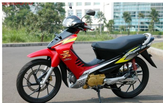
Gambar 2.1 Sepeda Motor Konvensional

Sepeda motor adalah kendaraan roda dua yang digerakan oleh sebuah mesin uap atau mesin motor bakar (Dirwan,2021). Pembakaran terjadi di dalam mesin atau disebut dengan internal combustion engine . Prinsip kerja motor bakar secara sederhana yaitu dengan mengubah energi fosil sebagai bahan bakar menjadi energi panas sebagai tenaga untuk menggerakkan sepeda motor.