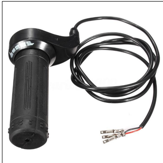
Gambar 2.7 Hand Gas Throttle

Sama halnya dengan hand gas pada sepeda motor biasa, Hand Throttle merupakan alat yang berfungsi untuk mengatur kecepatan pada motor listrik. Hand throttle bekerja dengan cara di putar, putaran ini akan dikirim sebagai sinyal ke kontroler untuk diartika sebagai kecepatan pada motor listrik. Semakin kencang memutar hand throttle akan semakin kencang pula laju sepeda motor listrik.