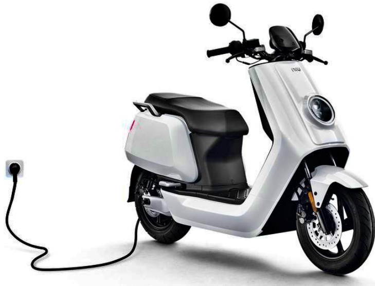
Gambar 2.2 Sepeda Motor Listrik

Sepeda Motor listrik merupakan pengembangan dari sepeda motor konvensional. Dimana mesin penggerak motor bakar diganti dengan mesin tenaga listrik. Sepeda motor listrik adalah sebuah sepeda motor yang menggunakan Energi listrik sebagai Sumber penggeraknya, Kendaraan listrik merupakan salah satu langkah untuk mengurangi ketergantungan kita terhadap energi fosil karena jenis kendaraan ini menggunakan penggerak berupa motor listrik, yang dimana sumber energi listriknya di suplay dari baterai dan tempat penyimpanan energi lainnya (suwarto,2021). Energi listrik diubah menjadi energi gerak (putar) oleh sebuah komponen berupa motor listrik DC. Putaran dari motor listrik DC ini yang menyebabkan sepeda motor listrik dapat berjalan seperti kendaraan lain pada umumnya. Secara umum terdapat 3 komponen utama dalam sepeda ataupun sepeda motor listrik yaitu motor penggerak, baterai dan kontroler.