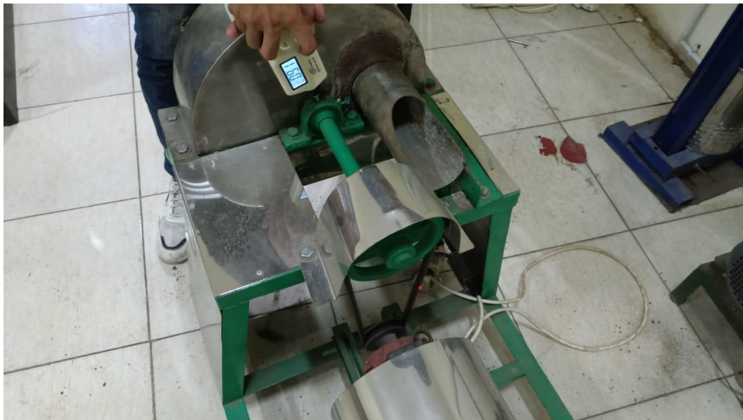
Gambar Pengujian Displacement Bearing 2