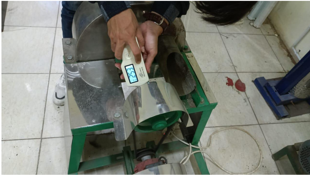
Gambar Pengujian Displacement Bearing 1