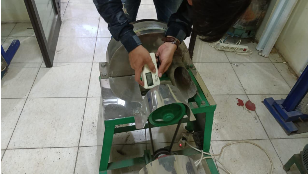
Gambar Pengujian Acceleration Bearing 1