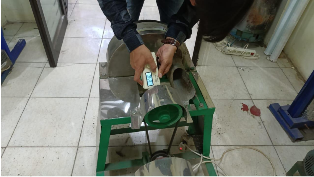
Gambar Pengujian Velocity Bearing 1