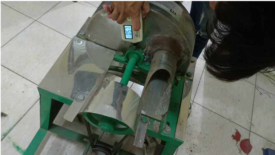
Gambar Pengujian Acceleration Bearing 2