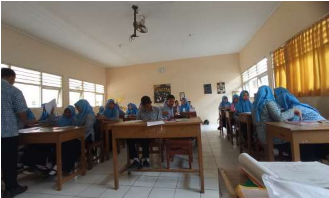
Foto 2. Pelaksanaan layanan konseling kelompok