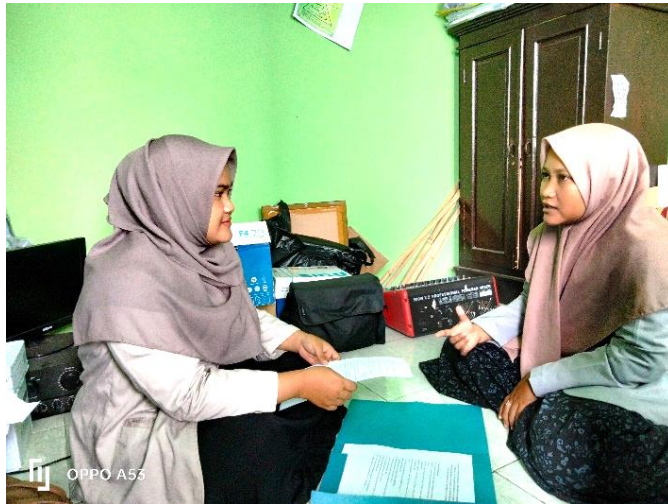
Wawancara dengan salah satu Ustadzah