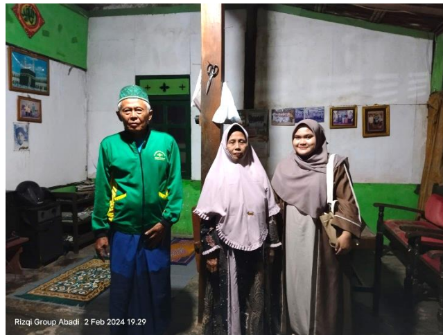
Wawancara dengan salah satu wali santri