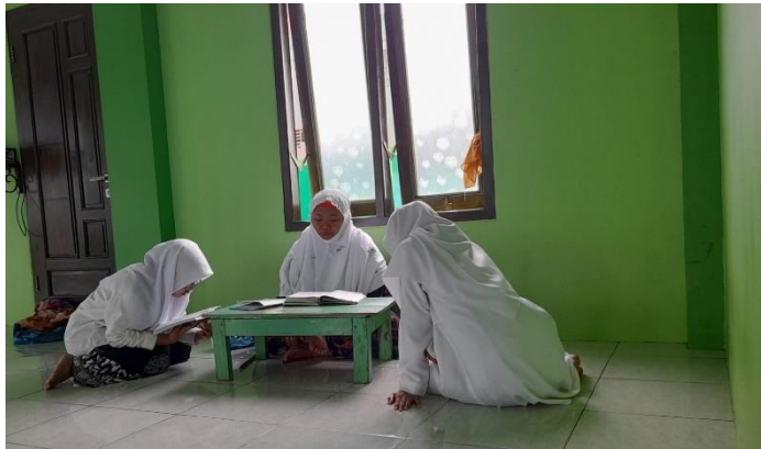
Kegiatan setoran halafan kepada Bunyai