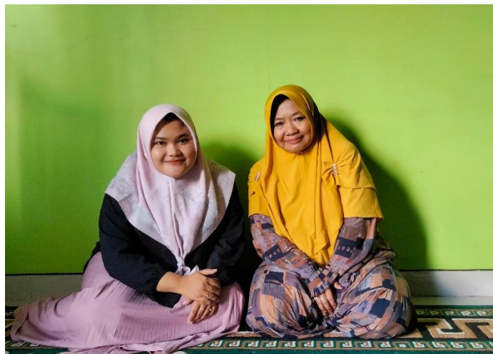
Wawancara dengan Pengasuh