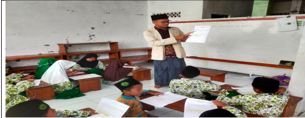
Foto Dokumentasi Penelitian