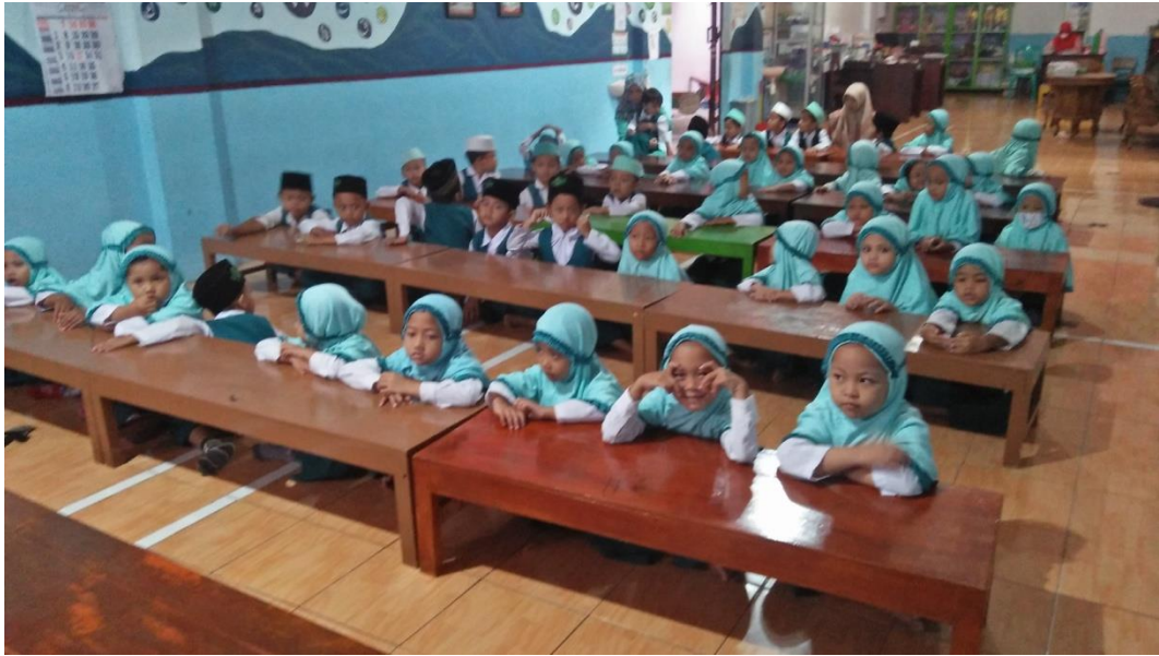
Lampiran 5 Foto Bentuk Perilaku Prososial